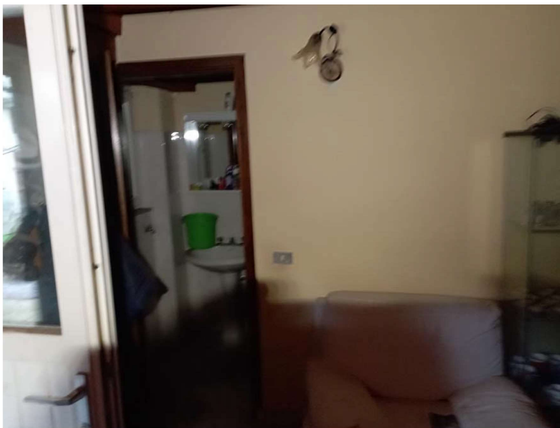
F16 CORPO C PIANO PRIMO