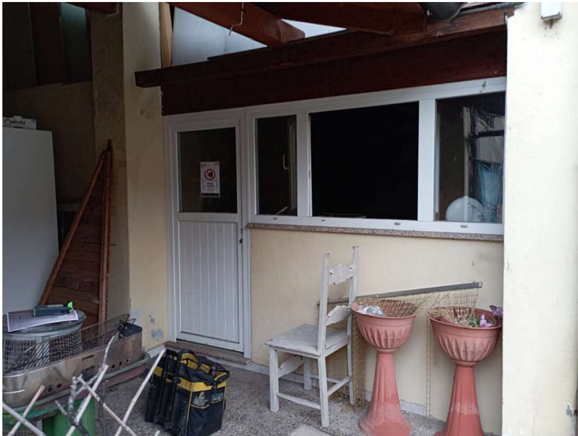
F12 CORPO C PIANO TERRA